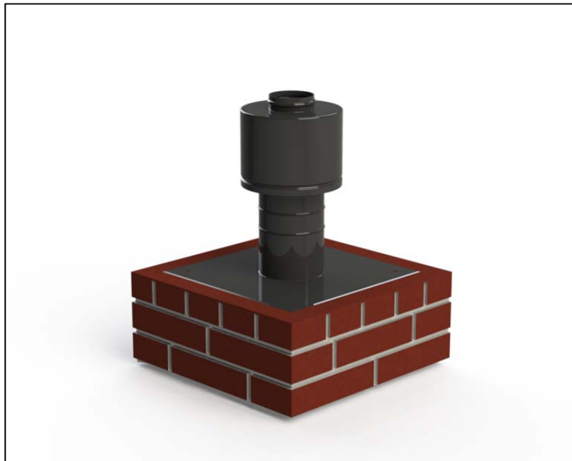
Figure 10 : Terminal Cheminée spécifique pour raccordement des appareils à gaz à circuit de combustion non étanche