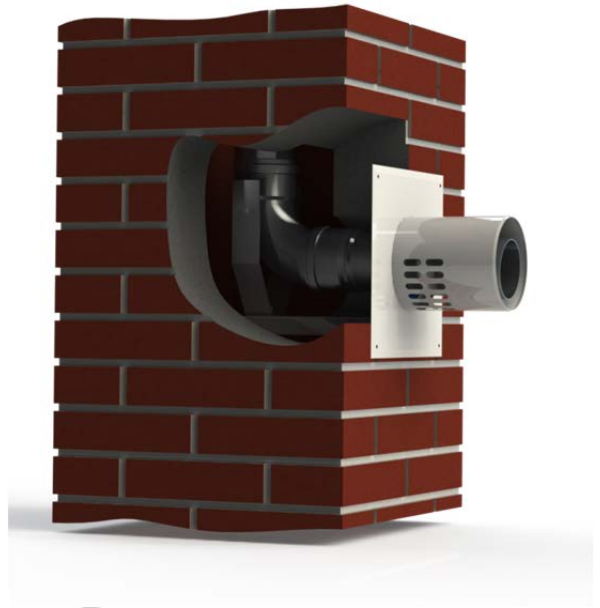
Figure 9b : Plaque B 3 pour Cox-Aluminium – Montage mural