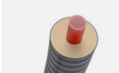
Figure 1 – CPX PUR-KING UNO