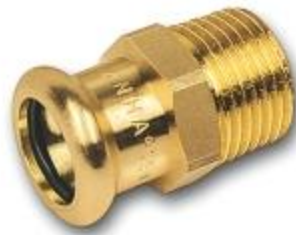
Figure 3 – Exemple de raccord en bronze sans plomb