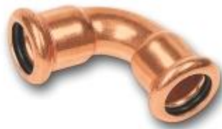
Figure 2 – Exemple de raccord en cuivre